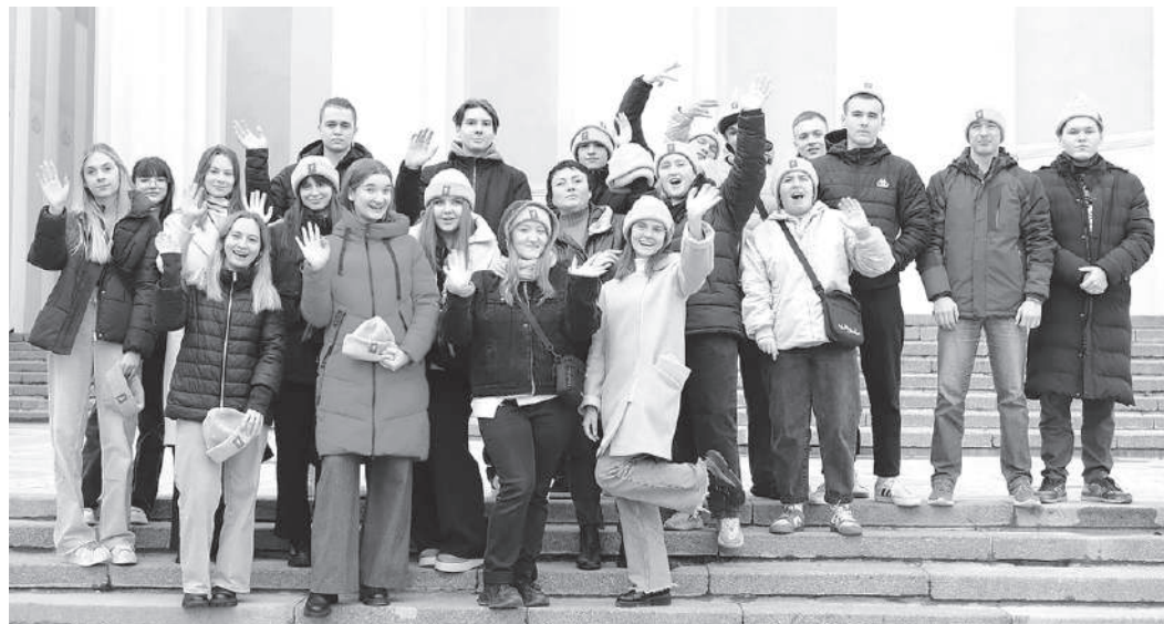
Привет, «Россия», мы к тебе за впечатлениями!