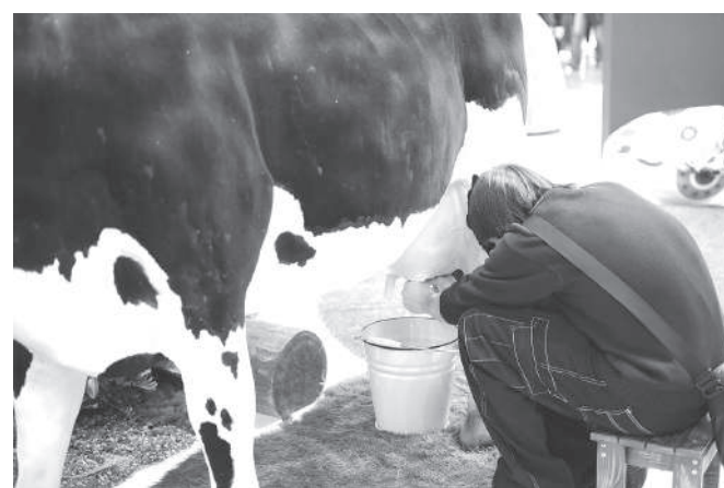
«Стой смирно, Бурёнка! Сейчас я тебя доить буду»