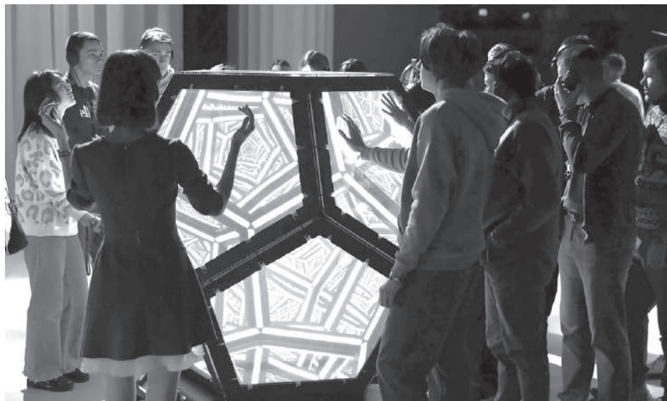
Ребята рядом с порталом в будущее – стеклянной конструкцией с неоновой подсветкой