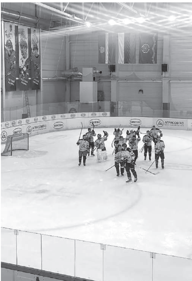
«ХардСтрой», уверенно стартовав в 13-м фестивале Ночной хоккейной лиги, успешно поддерживает статус лидера турнира

Региональный этап будет проводиться до апреля-мая. Ребята сыграют три круга, в общей сложности проведя