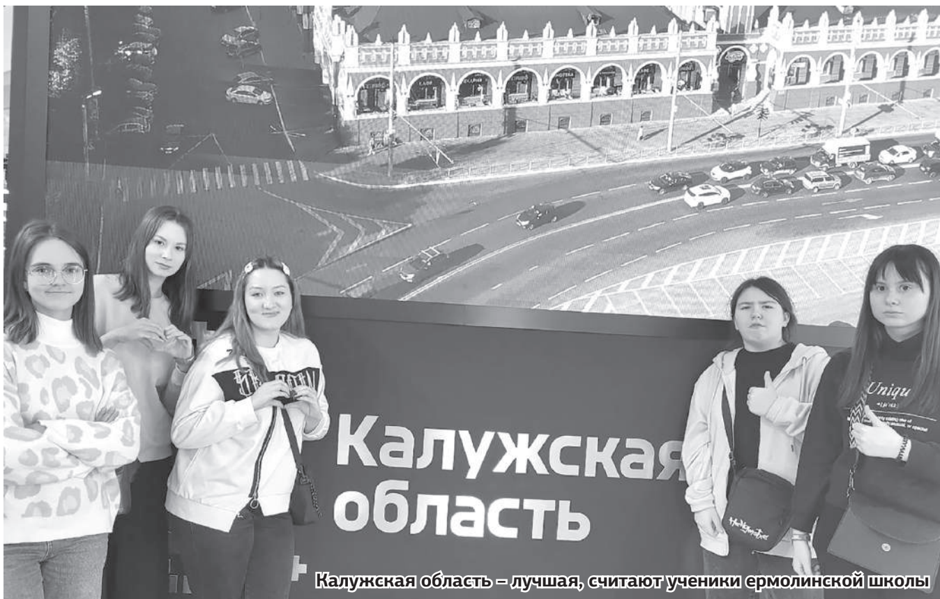
Калужская область – лучшая, считают ученики ермолинской школы

«Стало интересно, почему рядом с коровой стоит ведро? Чтобы дополнить общую картинку, подумали мы. Оказывается, нет. Нам пояснили, что выставочный образец можно подоить. Что мы и сделали. Процесс добытия импровизированного молока понравился», – делятся впечатлениями школьники.