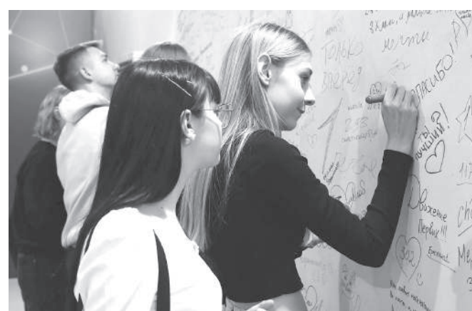
Боровчане оставили свои пожелания и благодарности на специальной стене павильона ВДНХ