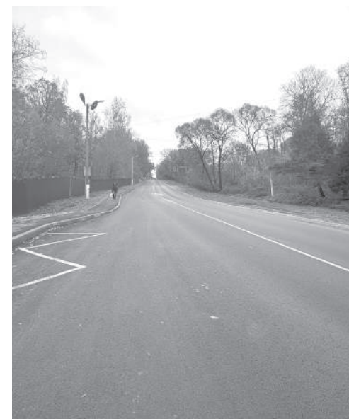
Наиболее проблемное покрытие улицы Ленина было полностью заменено в этом году, что снимает массу вопросов

блемы не только Ермолина, но и Боровска - уборки горок. Подъём на улице Ленина славится активным движением фур с находящихся рядом предприятий. В любой маломальский гололед здесь образуются пробки. С этой проблемой собираются бороться как первоочередной посыпкой и уборкой именно этих «узких мест», так и расположением в начале и середине подъема запасов песка, который можно использовать как для посыпки тротуара,