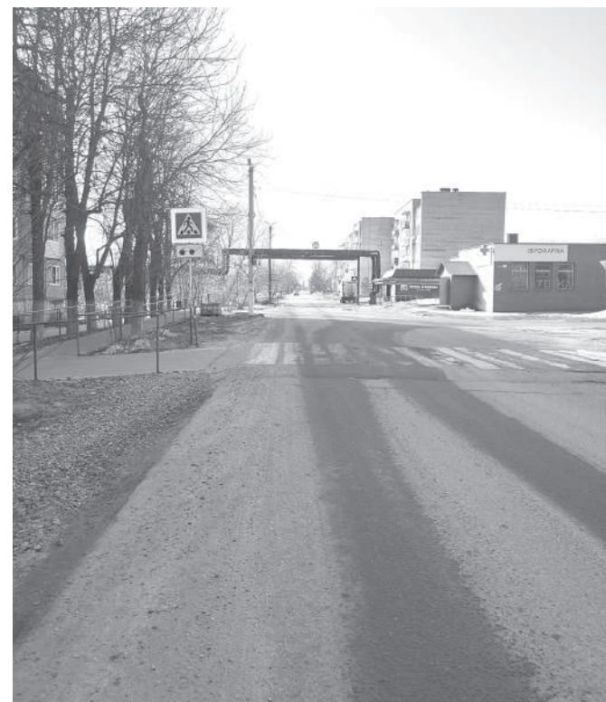
Если Ермолино выиграет грант, то этот микрорайон буде просто не узнать

Отдельно жители отметили местную частную баню, за паром которой также приезжают из самых разных уголков. Учитывая популярность данной услуги во все вре-