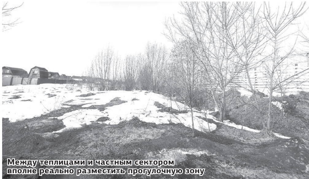
Между теплицами и частным сектором вполне реально разместить прогулочную зону