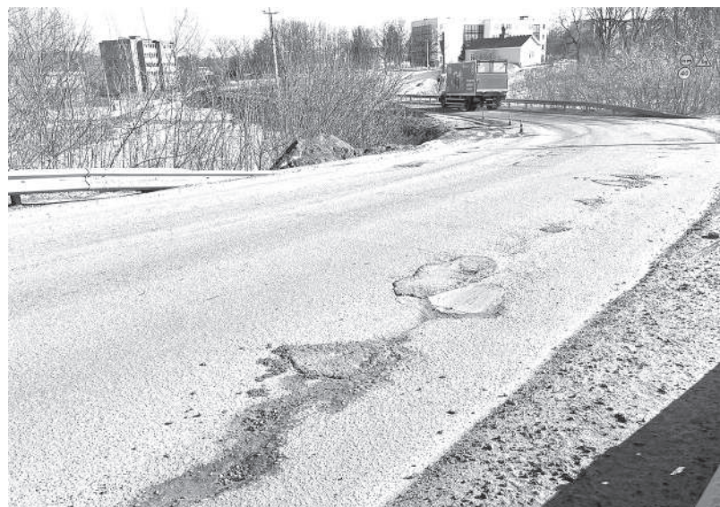
Вместо «впукостей» теперь «выпуклости»

«Перспектива есть всегда, но на данный момент денег в бюджете на ремонт этой улицы нет. Сказать точно, что покрытие восстановят в этом году, я не могу. Если ермолинская адми-