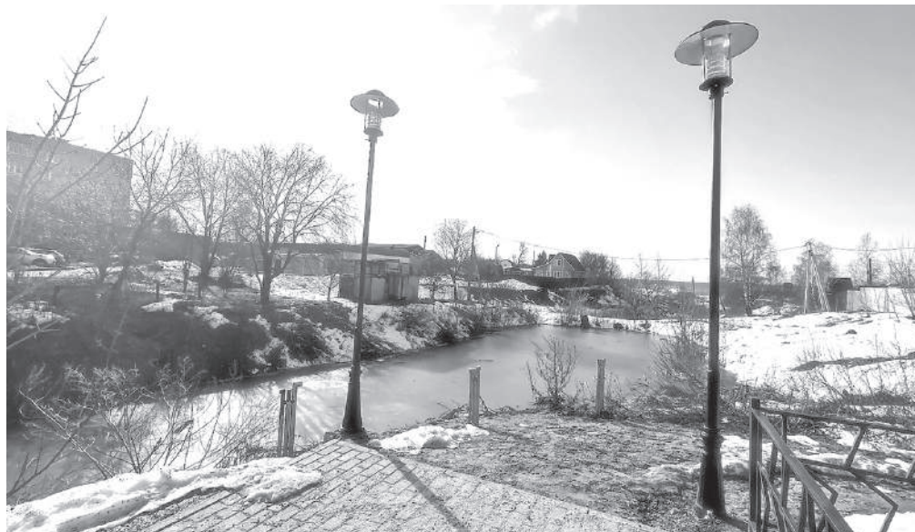
Эту зловонную лужу возле мемориала можно превратить в благоустроенное место отдыха