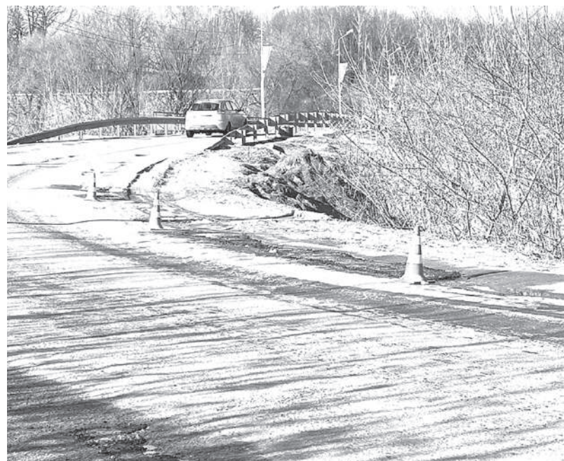
Латать асфальт на разбитой дороге продолжили на этой неделе

нистрация написала и отправила письмо, это ещё не значит, что Боровский район возьмёт деньги неизвестно откуда и потратит на конкретные цели этого города.