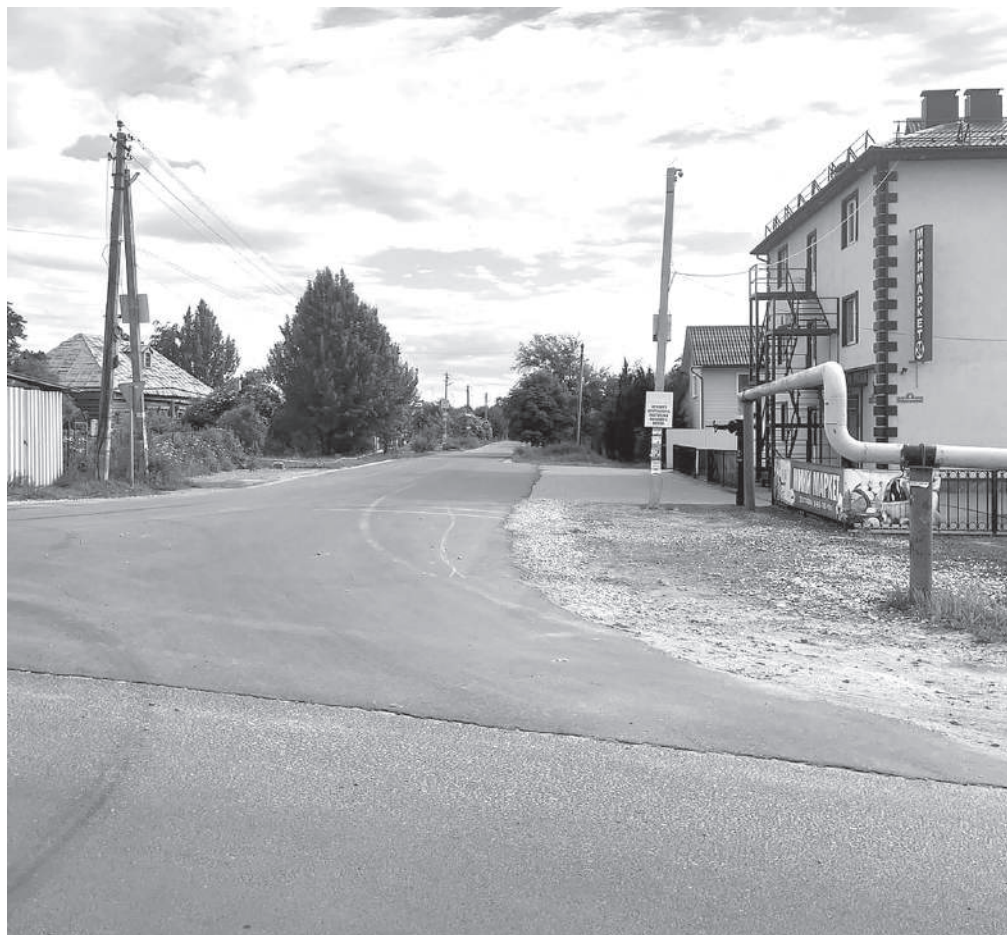
Ермолинская улица Островского – густонаселённый микрорайон, только источников воды в нём – раз, два и обчёлся

стемы люди и пользуются водой, правда, тоже не всегда.