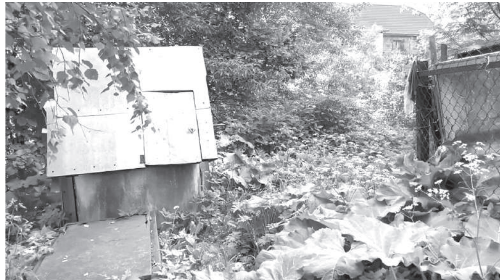
Вода из старого колодца, расположенного в начале улицы, давно непригодна для питья

упадёшь и ноги переломаешь. А если колонка сломается, то вообще не знаю, где мне брать воду».