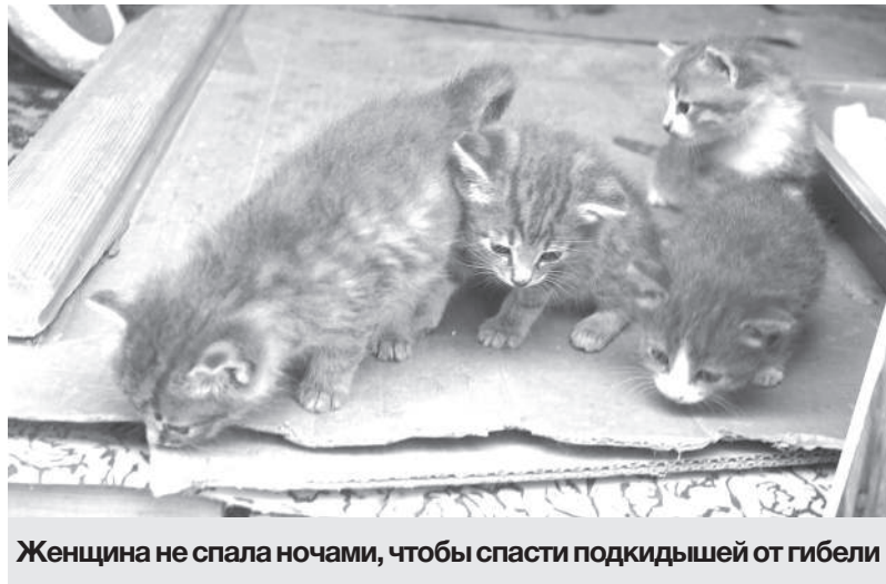
Женщина не спала ночами, чтобы спасти подкидышей от гибели