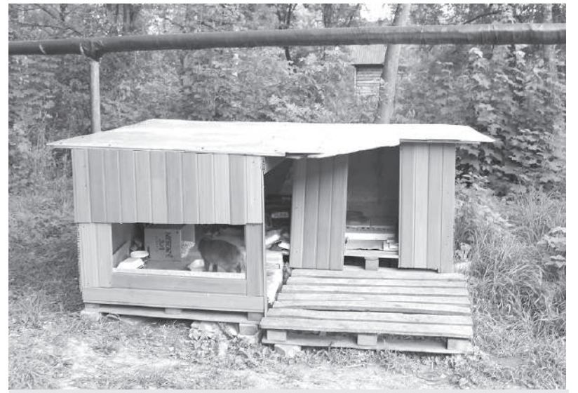
В таком домике дождь и ветер не страшны