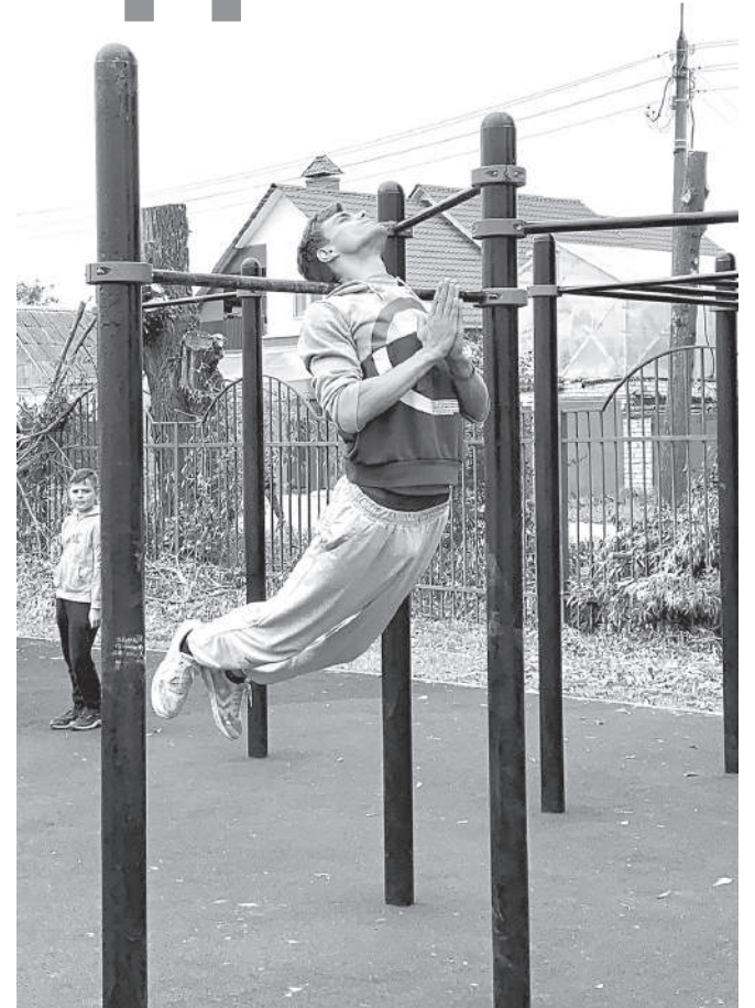
К примеру, так выглядит вис на шее или «Cristo»

«Приятно видеть, что с каждым годом уровень ермолинских спортсменов растёт, а значит это направление