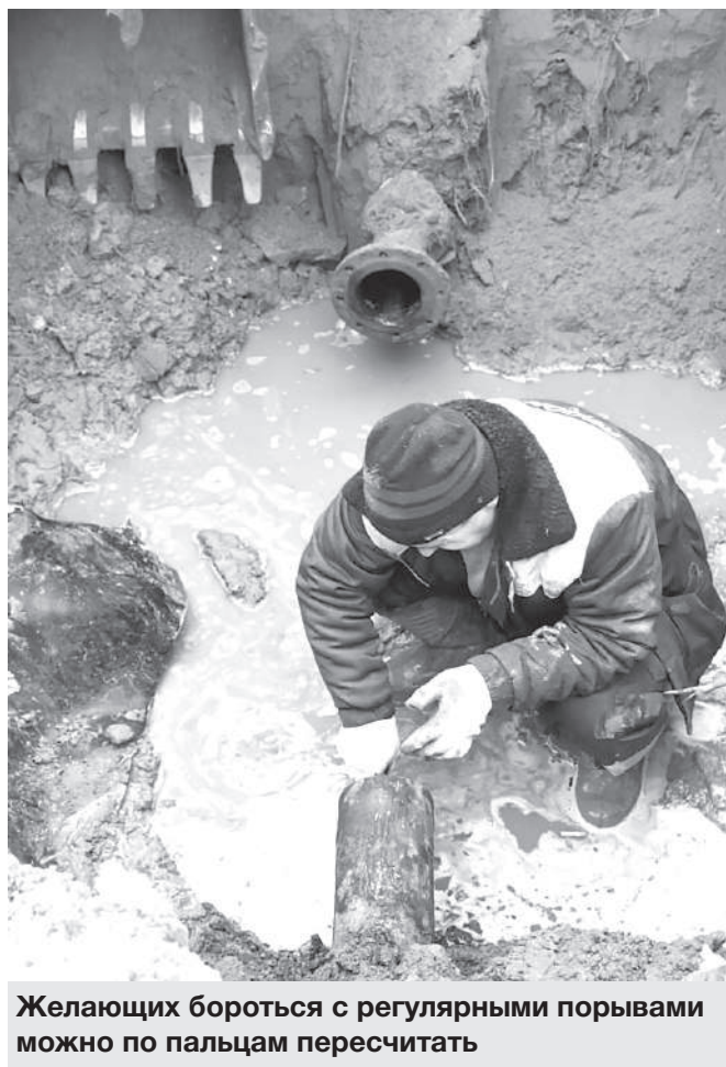
Желающих бороться с регулярными порывами можно по пальцам пересчитать

Действительно срок службы многих артерий уже давно перевалил отведённый им срок. И понятно, что по щелчку заменить системы по всему городу просто не получится. Однако людей тоже можно понять. Кому понравится при малейшем журчании в кране бросаться набирать тазики и прокручивать в голове