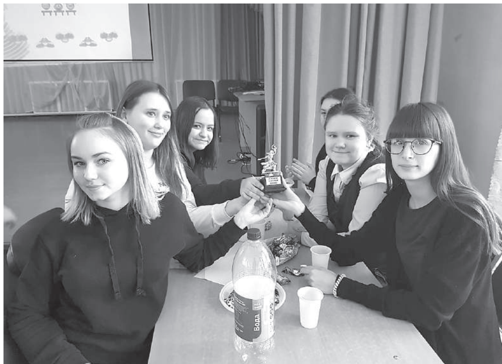
За командный дух приз получила команда «Нас Маша позвала»