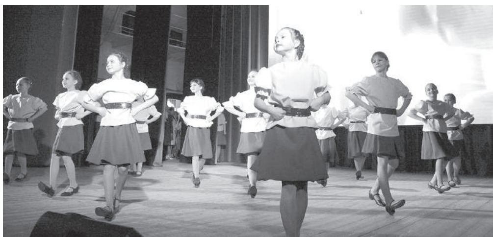
«Казаченька» от «Ритма»