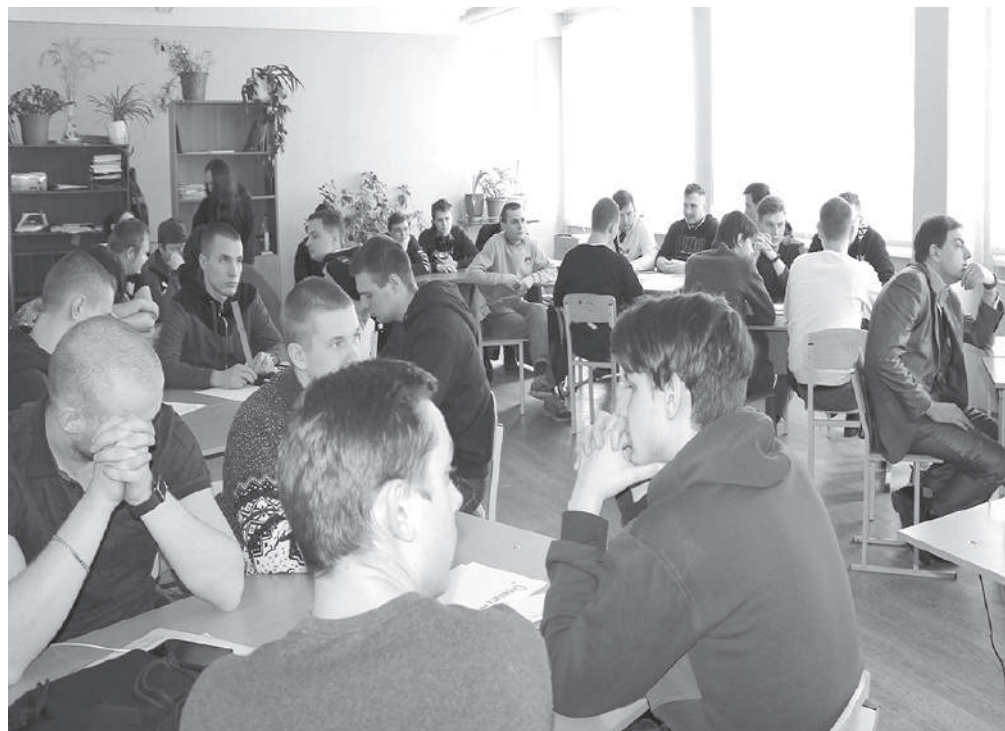
Участники за решением интеллектуальных задач