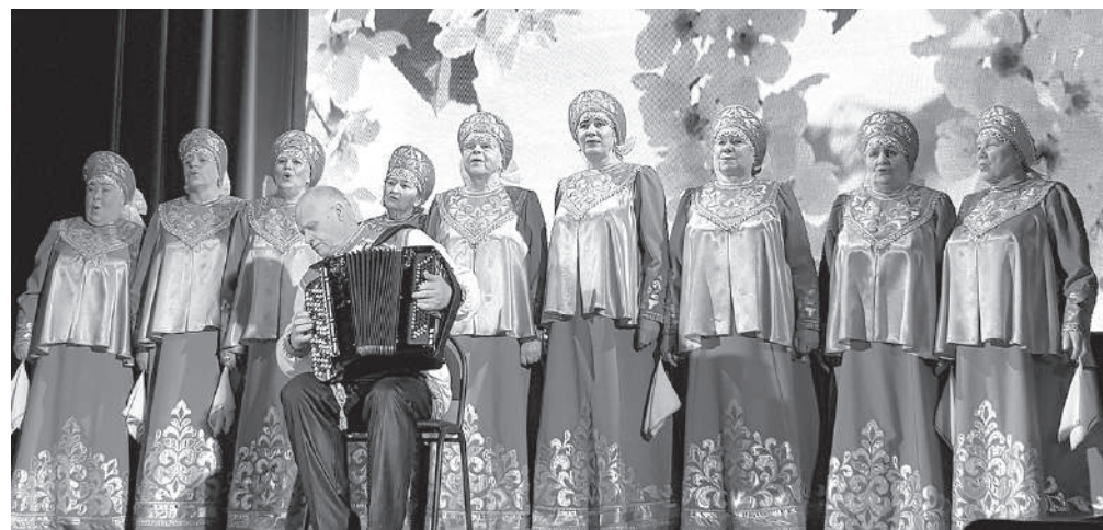
Русский ответ поп-культуре от фольклорного ансамбля «Бабье лето»