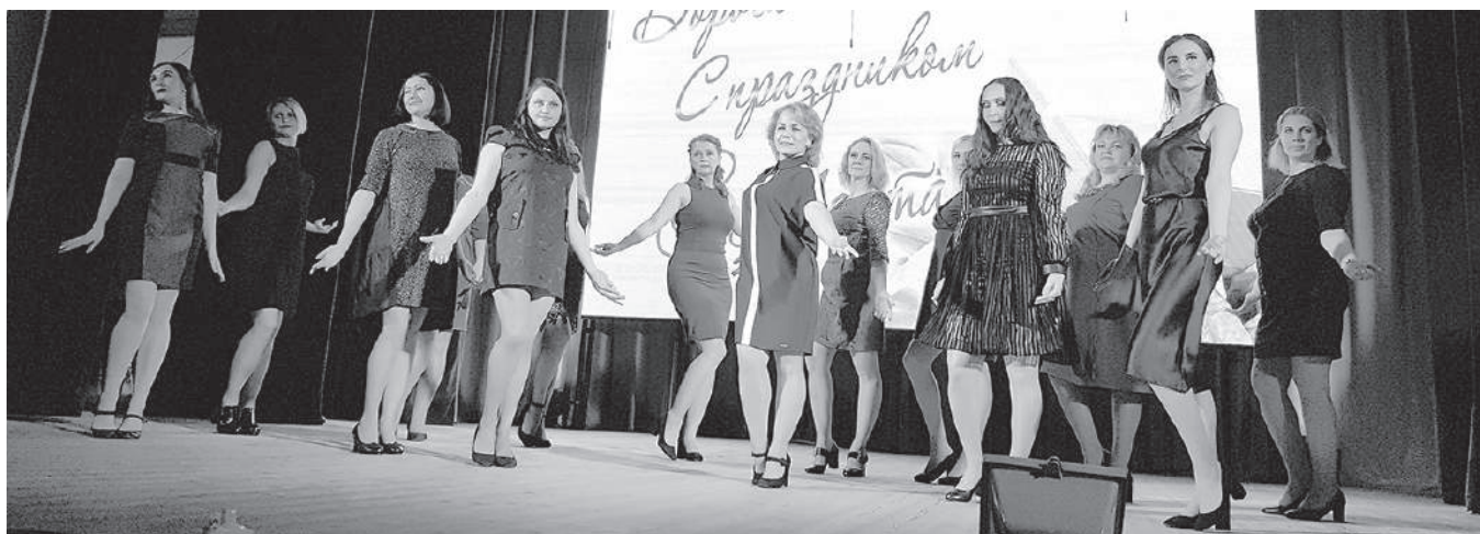
Дефиле прекрасных дам