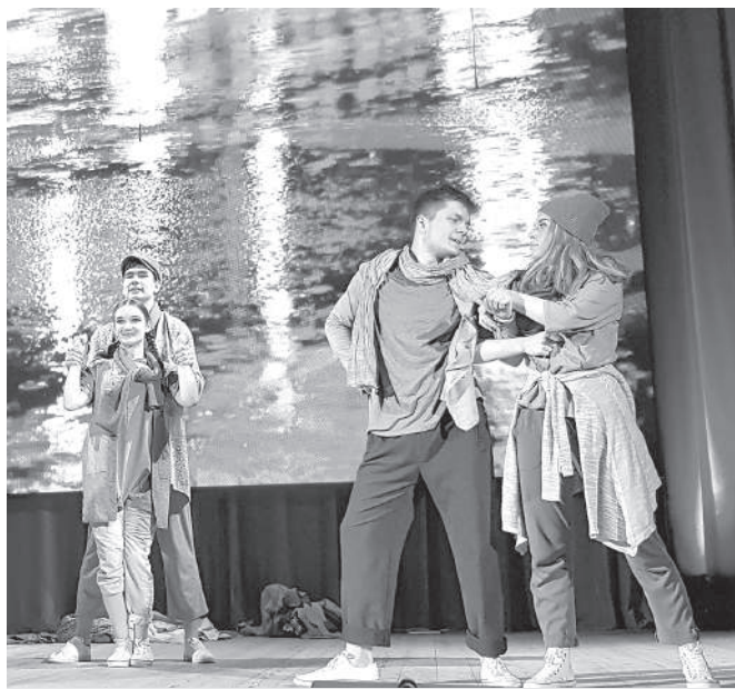
Вдохновение весны от «Fancy»

6 марта впервые после начала карантина Дом культуры «Полёт» открыл свои двери для зрителей.