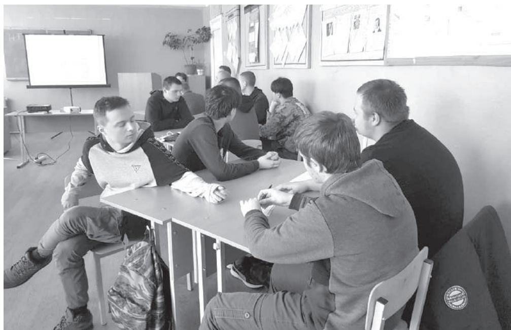
Студенты ермолинского техникума обсуждают тему здорового образа жизни

4 марта интеллектуальные баталии продолжились на территории ермолинской средней школы.