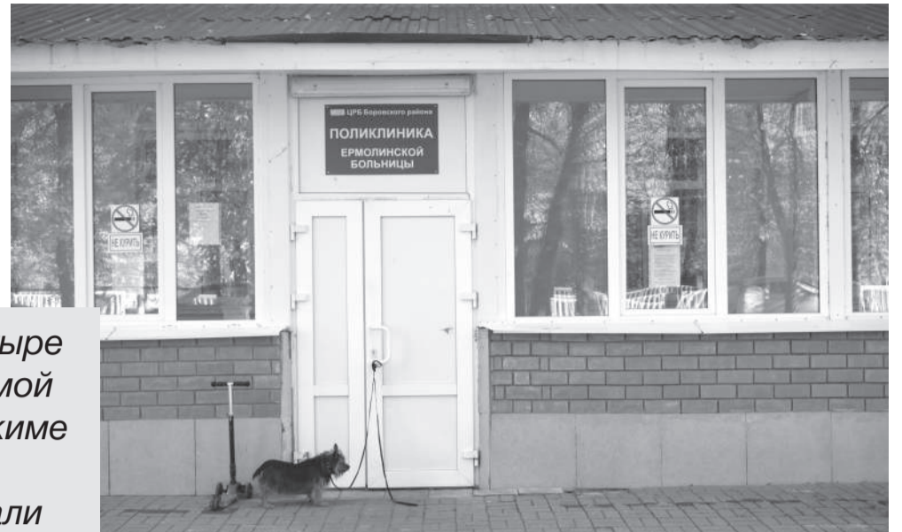
Всего в ермолинской поликлинике работают три терапевта

Ермолинские терапевты принимают ежедневно по четыре десятка человек, после отправляются к пациентам домой по своему муниципалитету и восьми деревням и в режиме нон-стоп дают консультации по телефону. О том, как справляются люди (не роботы) с такой нагрузкой, узнали «Боровские известия»