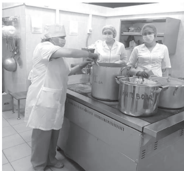
Повара из «Звездочки» - настоящие кулинары