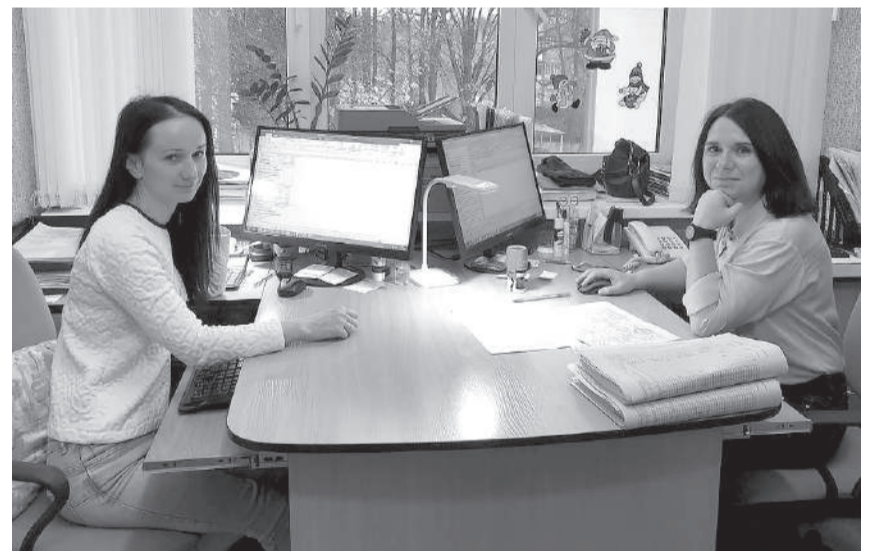
В бухгалтерии образовательных учреждений – всегда порядок