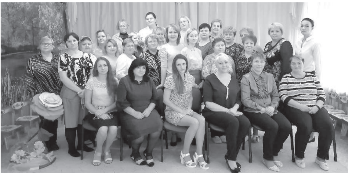
Коллектив детского сада «Лебедушка» дарит ребятам любовь и радость