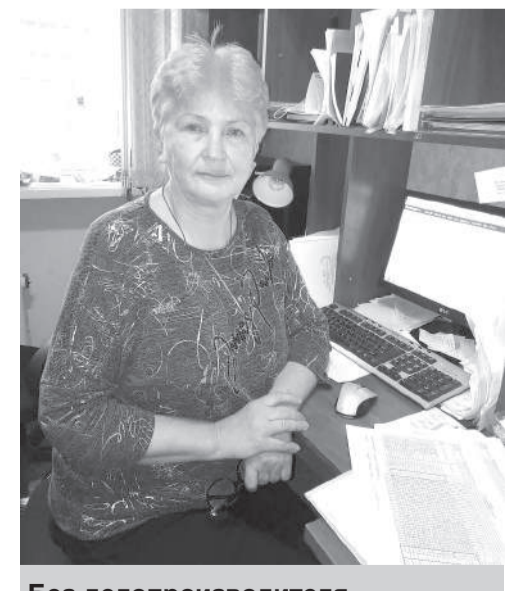
Без делопроизводителя в образовательном учреждении как без рук