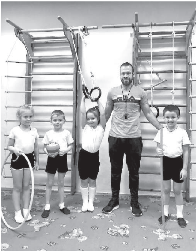
Физкульт-привет от юных спортсменов и замечательного педагога

мовой, любые проблемы всегда решаются вместе и быстро. Редко можно назвать коллектив «настоящей командой», но мы таковыми и являемся. Сотрудников объединяют профессионализм и оптимизм. нас отличает не только умение работать, но и отдыхать. Дни рождения, праздники и другие радостные события отмечаем дружно и весело. Наш девиз: «Один за всех и все за одного». Желаем всем работать в таких командах!