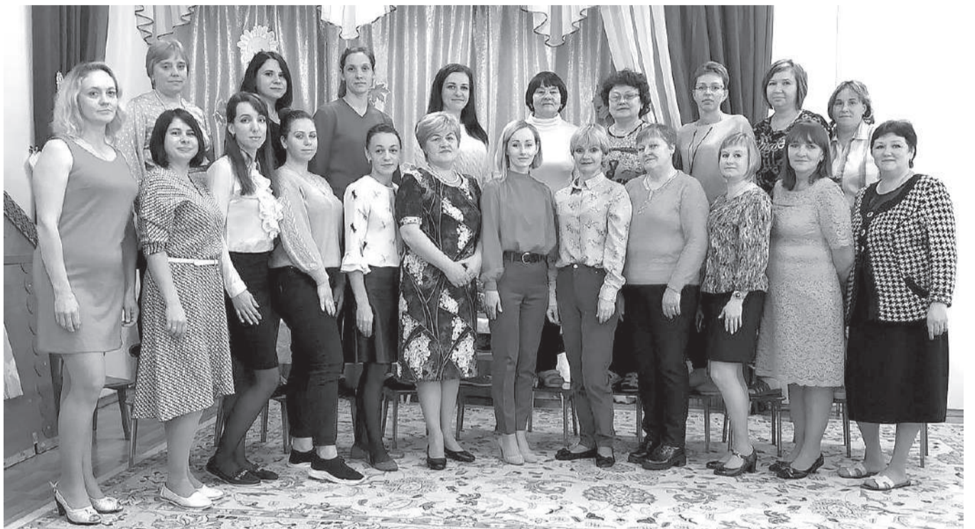
Сотрудники детского сада «Звездочка» делают всё возможное, чтобы дети были счастливы