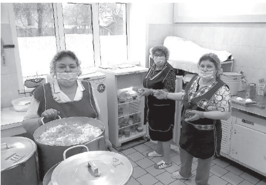
Сотрудники пищеблока из детсада «Лебедушка» готовят для ребят вкуснейшие блюда