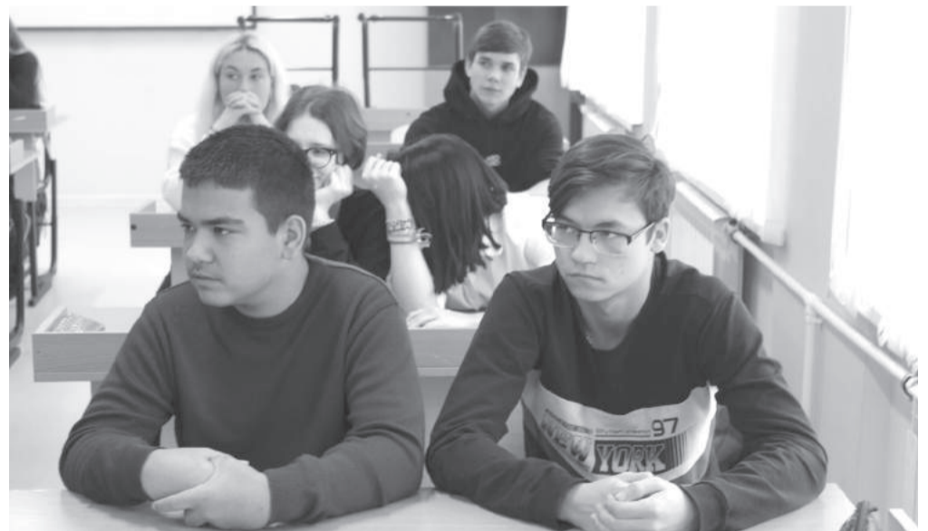
Многим ребятам непросто определиться с будущей специальностью