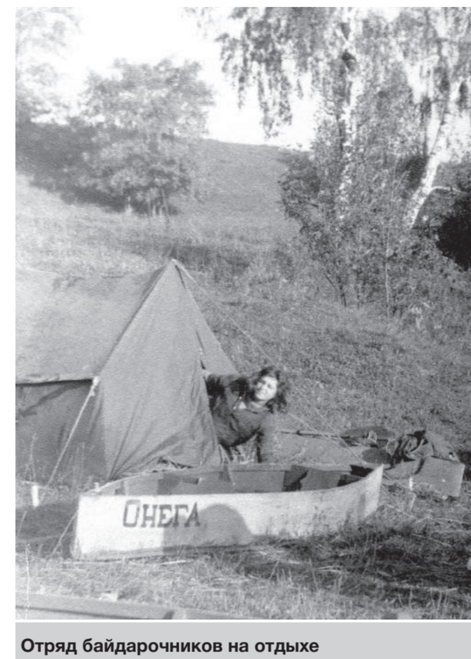
Отряд байдарочников на отдыхе

Разнообразный рельеф поймы Протвы издавна способствовал возникновению поселений, от крохотных ху-