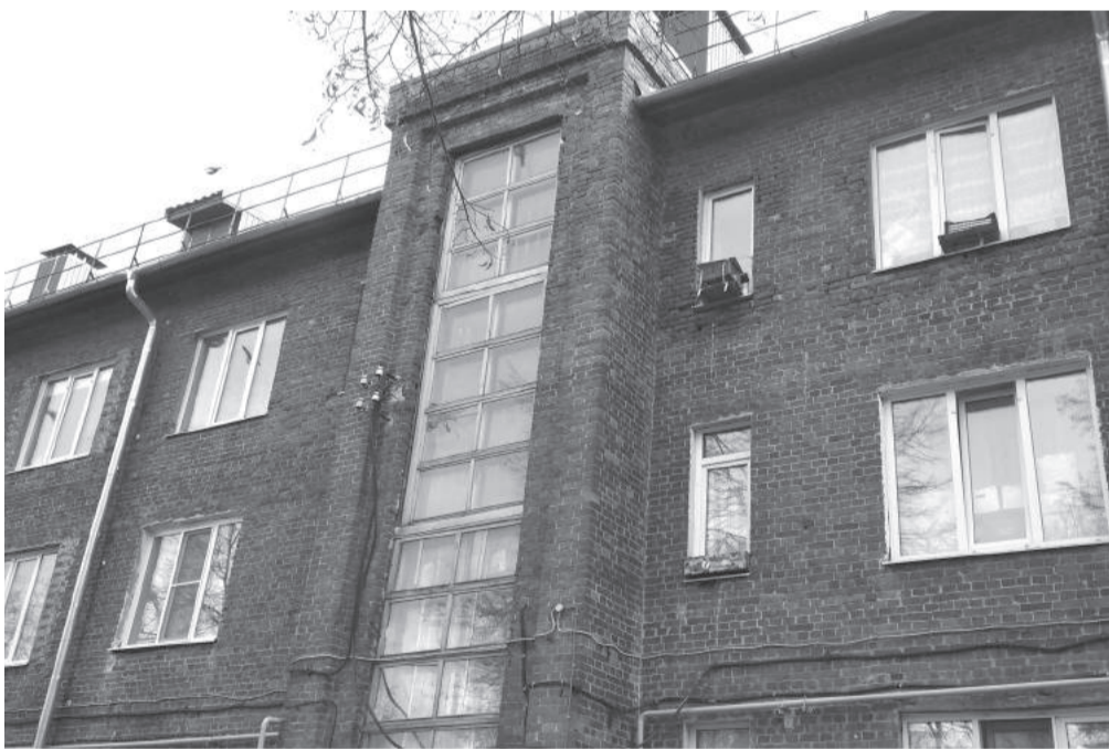
Дом №6 на Площади Ленина теперь обслуживает другая УК

выставили счета и теперь постепенно начисляют пени за просрочку платежей. Пройдёт ещё немного времени, и сумма долга у них начнут насильно списывать с банковских счетов. И здесь уже никого не интересует, что среди жильцов дома есть престарелые, инвалиды и многодетные. Главное, чтобы долги были во время оплачены.