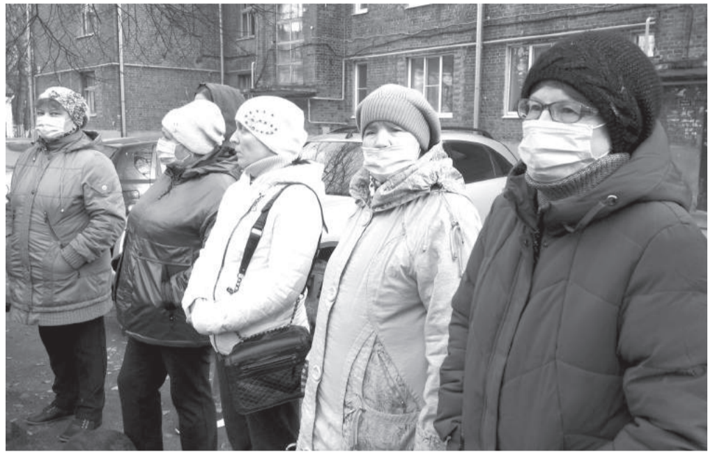
Жители города боятся, что за услуги «Ермака» им придётся заплатить немалые суммы

«Исходя из социального положения граждан, я выставял им счета из расчёта по пять рублей за квадратный