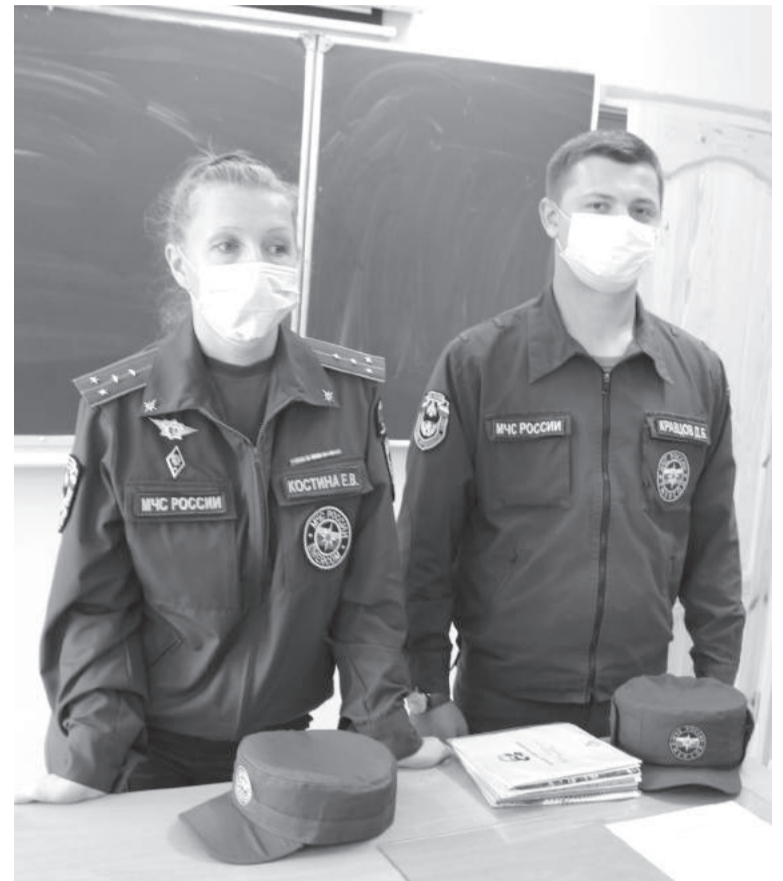
Сотрудники МЧС рассказали ребятам о возможностях своей профессии