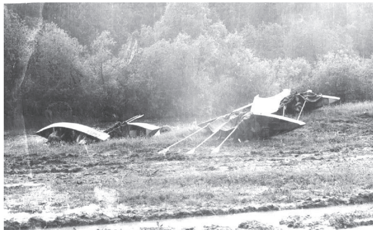
И байдаркам нужен отдых