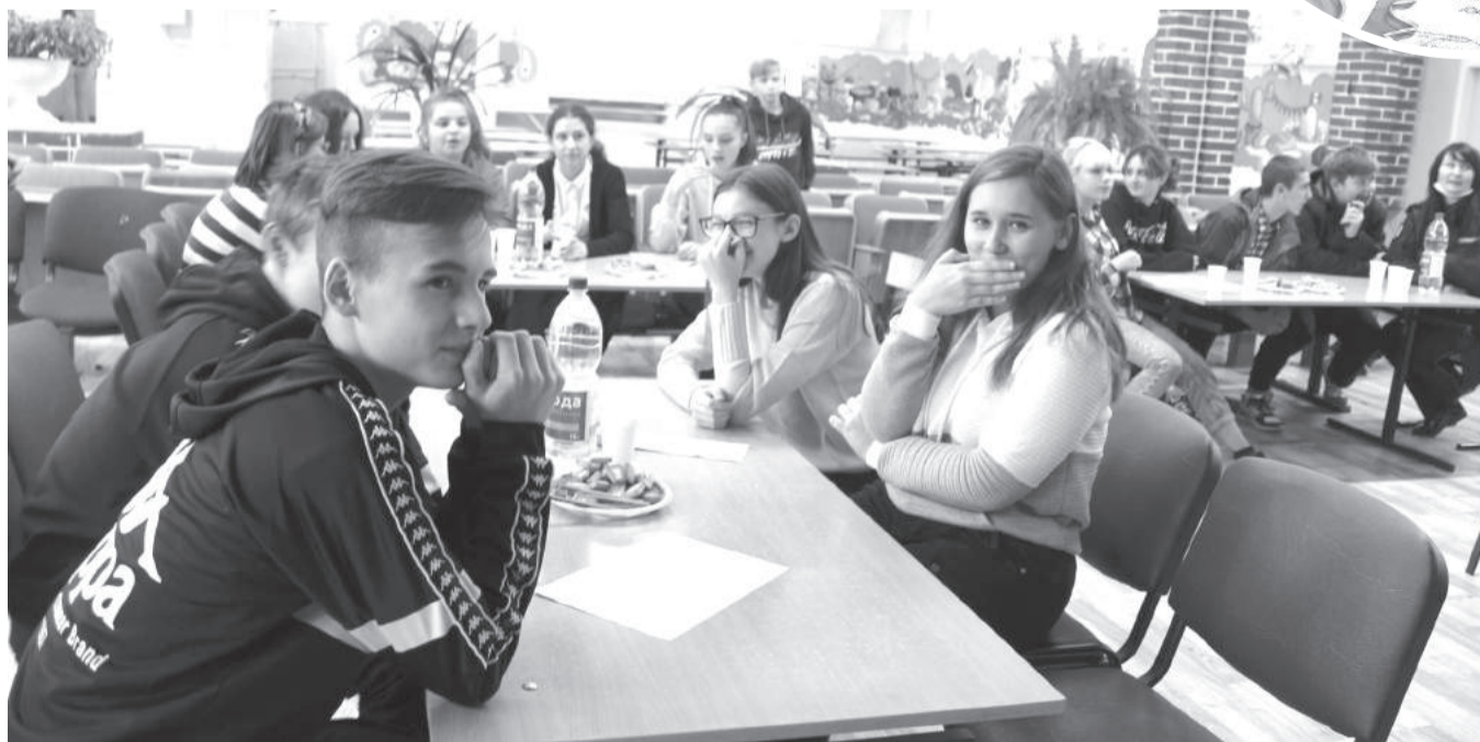
Квиз вызвал у участников бурю ярких эмоций