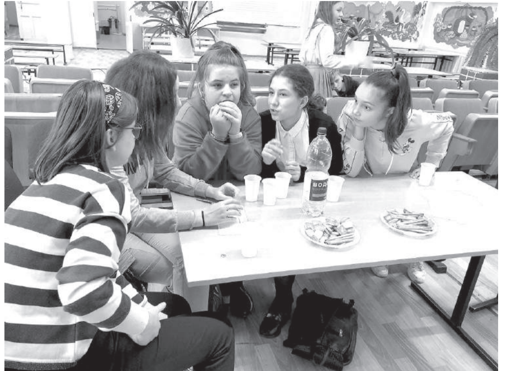
Во время игры прозвучало немало каверзных вопросов