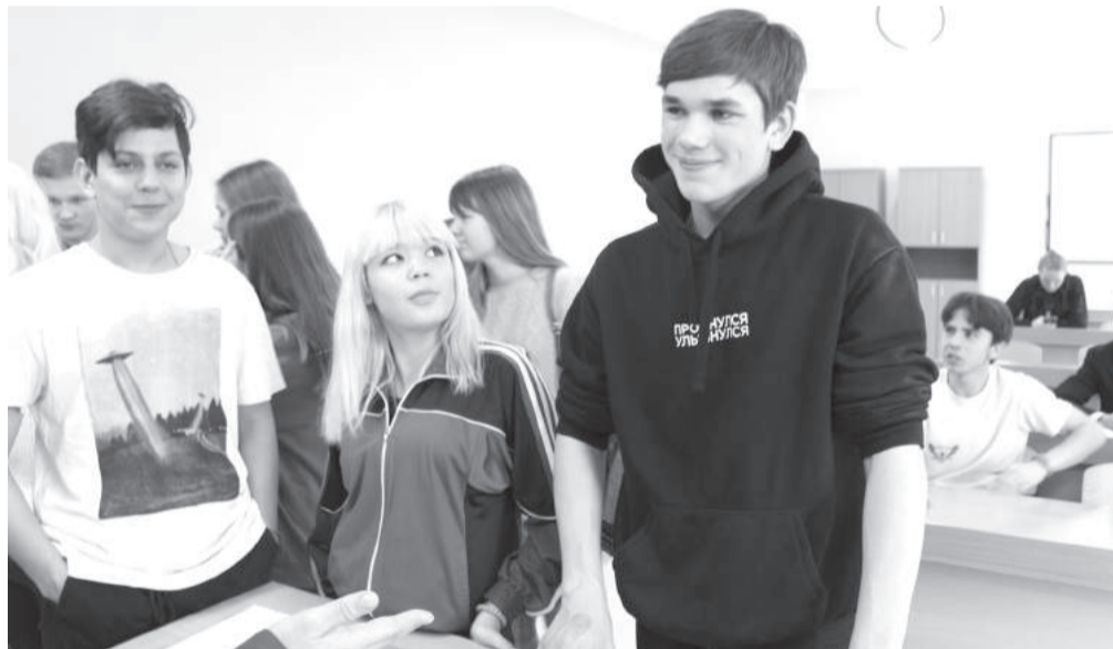
Среди ермолинских ребят есть те, кто мечтает стать пожарным