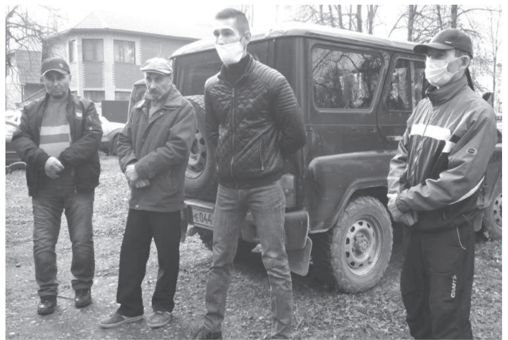
Разобраться в проблеме пришли ермолинские депутаты