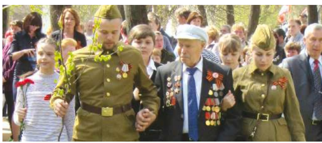
Сражались на всех фронтах