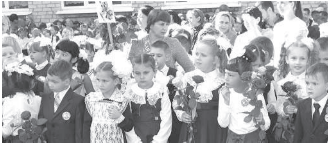
Ученье - свет