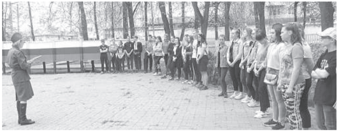
По скверу, как по минному полю