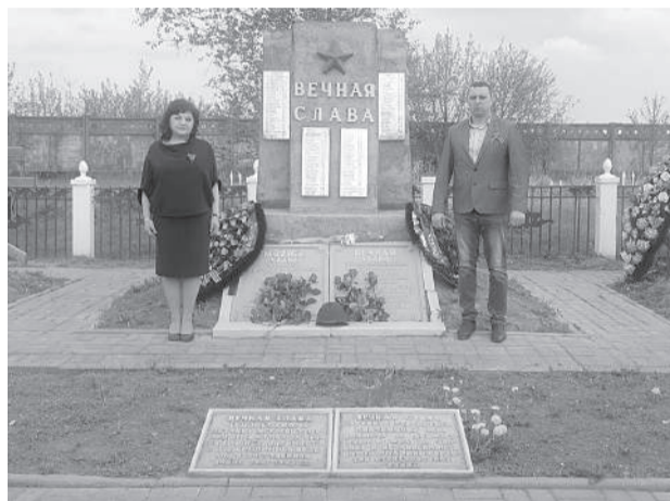
Возложение венков от ермолинской администрации и депутатского корпуса состоялось на братских могилах, на аэродроме в воинской части №3694, на улице Боровской, в районе АЗС и возле строительного рынка