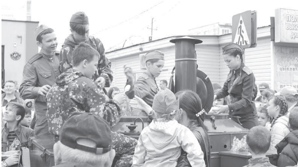
Всех жителей и гостей города угощали вкуснейшей солдатской кашей. Раздавали её совсем юные волонтеры