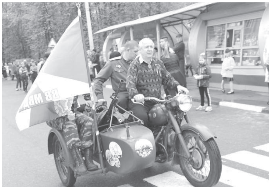
В митинге приняли участие представители военно-патриотического пробега